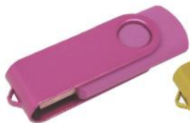
МЕТАЛЛ, ОКРАШЕННЫЙ ПО PANTONE